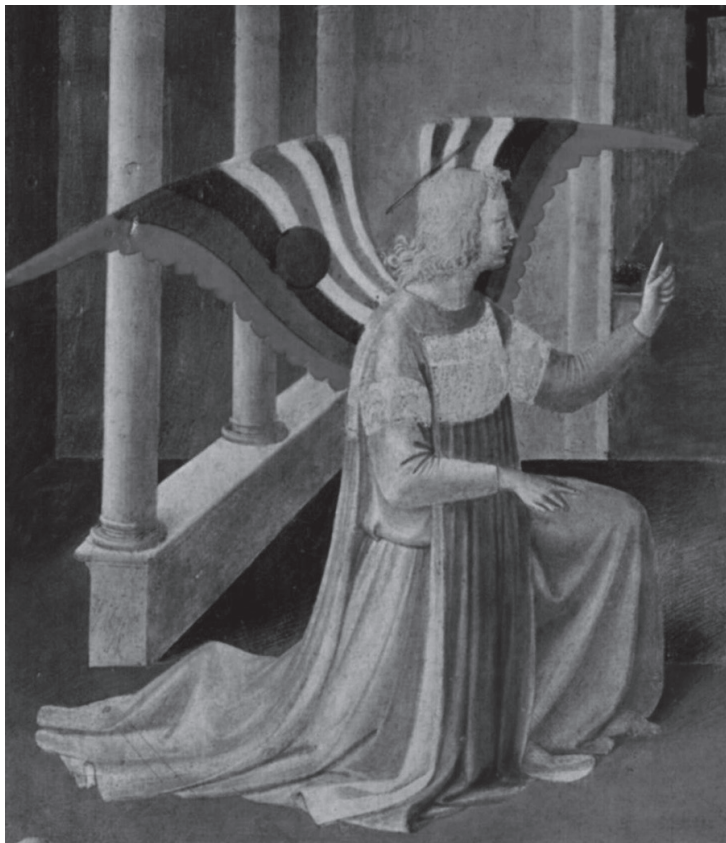
Fig. 1. Florence, couvent San Marco, Fra Angelico, Annonciation. Détail.

Le livret de Messiaen est donc assez économe en matière de spectaculaire. Ôter une guenille suffit pour donner l'illusion d'une guérison. Quant aux stigmates, faire saigner un personnage avec réalisme est une vieille affaire théâtrale. Le personnage de l'ange est lui-même très sobre sur le plan visuel. L'effet de merveilleux est produit par l'acouphanie de cette unique soliste féminine dans un univers exclusivement masculin. Déguisé sous sa robe de bure, l'ange est merveilleux par sa seule voix. Même le tableau de l'ange musicien n'est pas un contre-exemple sérieux. En effet, Olivier Messiaen a donné la source des didascalies du cinquième tableau : une fresque de San Marco par Fra Angelico représentant l'Annonciation. Mais en donnant ce modèle très précis au costumier, Messiaen cherchait plutôt à limiter toute extravagance de mise en scène. L'ange de San Marco est humble, portant une tunique majestueuse, mais sans excès. Les motifs colorés des ailes (des bandes parallèles et un disque noir) sont presque géométriques, et aisément reproductibles par un costumier.