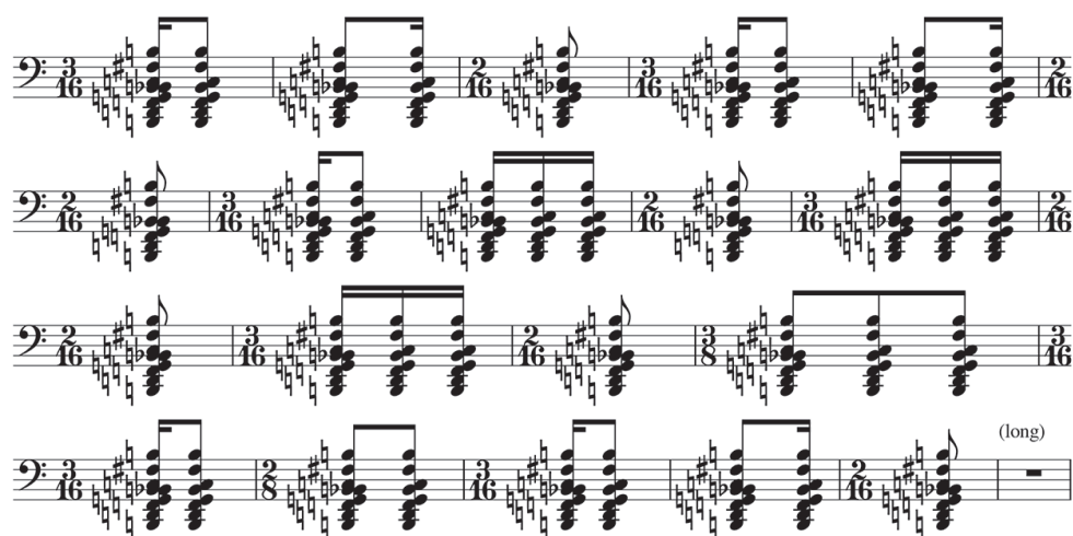
Fig. 3. Olivier MESSIAEN, Saint François d'Assise . Opéra en 3 actes et 8 tableaux, Paris, éditions Alphonse Leduc, 1983. Acte III, 7 e tableau.

Le passage des stigmates synthétise ces caractéristiques rythmiques de Saint François d'Assise .