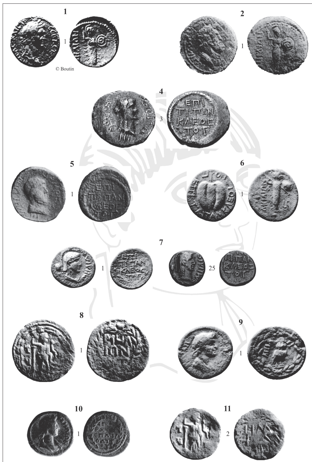
Appendice. Illustration des monnaies marquées d'un astérisque (*) (échelle 1).