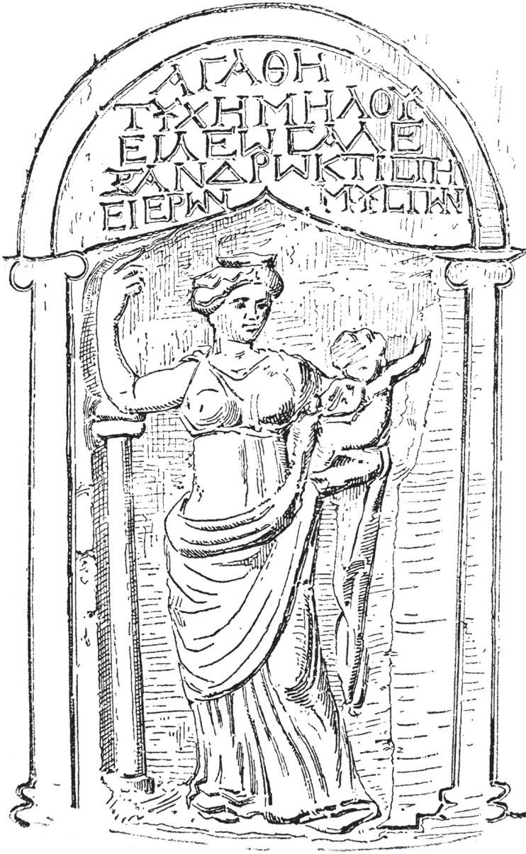
Fig. 3. Relief de Tychè et inscription IG, XII.3, 1098, provenant de la Salle des Mystes (d'après Wolters 1890, 248).