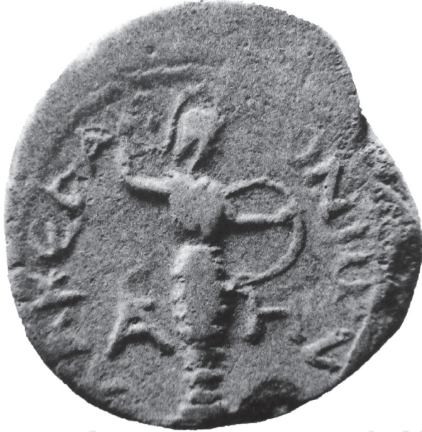
Fig. 2. Statue d'Athéna Chalkioikos sur une monnaie de Sparte de l'époque de Gallien (d'après BMC 9, n°87, pl. XXVI.8).

Parmi les nombreuses représentations monétaires d'Athéna archaïques 10 , seule l'une d'entre elles livre de très nettes similitudes avec celle des monnaies méliennes. Il s'agit d'une émission spartiate, frappée à l'effigie de Gallien (fig. 2) 11 . Les numismates s'accordent pour y reconnaître l'image de l'Athéna Chalkioikos , qui avait son sanctuaire sur l'Acropole de Sparte, et dont la statue de bronze aurait été réalisée par le Lacédémonien Gitiadas, au début du VI e s. a.C. 12 . L'hieratisme de la statue copiée sur les monnaies pourrait en effet correspondre à une œuvre de cette époque. En outre, une statuette en bronze d'Athéna, trouvée lors des fouilles du sanctuaire de Sparte et interprétée comme étant une copie miniature de l'œuvre du sculpteur 13 , présente des ressemblances troublantes avec les représentations monétaires de Mélos. Sur l'une des émissions les plus abondantes de l'île, où seule la tête de la statue est représentée, ces similitudes sont particulièrement frappantes (n°7) : tout comme sur la statuette, la déesse porte un casque à cimier qui lui couvre le début de la nuque, mais laisse l'oreille dégagée ; et de longues mèches parotides descendent le long de son cou.