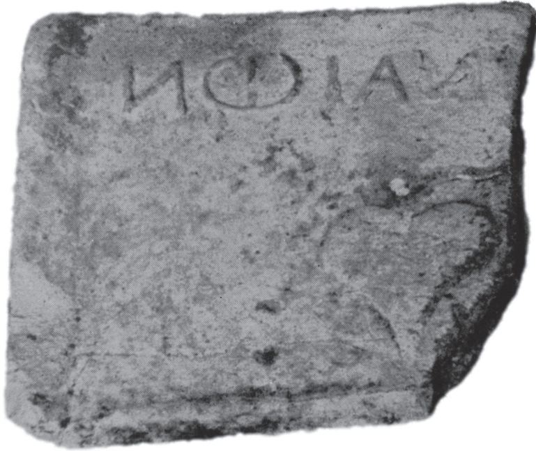
Fig. 4. Fragment de moule en terre cuite, trouvé sur le site de Fyrligos (Mélos), portant l'inscription rétrograde [ΑΘΗ]ΝΑΙΩΝ (d'après Papadopoulou-Zapheiropoulou 1966, pl. 407.δ).

inscriptions latines rétrogrades et clairement mises en rapport avec l'exploitation du soufre en Sicile sous l'Empire 79 . S. Raptopoulos voit dans le terme Ἀθηναίων l'indication des patrons des mines de soufre méliennes 80 . Il en fait des descendants des clérouques établis sur l'île au v e s. a.C., ce qui, sans autre preuve de l'existence d'une colonie athénienne à Mélos sous l'Empire, nous semble très improbable. Selon nous, l'ethnique Ἀθηναίων doit plus probablement se rapporter aux destinataires de la marchandise. Un parallèle tout à fait convainquant provient de nouveau d'Agrigente, où plusieurs moules portent l'inscription Romae , qui indique la destination des pains de soufre ainsi estampillés 81 . Il faut alors supposer que le volume de l'exportation du soufre mélien vers Athènes était assez élevé pour justifier la création d'un timbre spécial au nom de cette cité. Dès lors, il est possible que les symboles monétaires méliens aient été utilisés par "mimétisme" des monnaies athéniennes ; il s'agirait d'emprunts visant à faciliter l'insertion réciproque et la circulation des monnaies méliennes et athéniennes sur le marché local, voire régional.