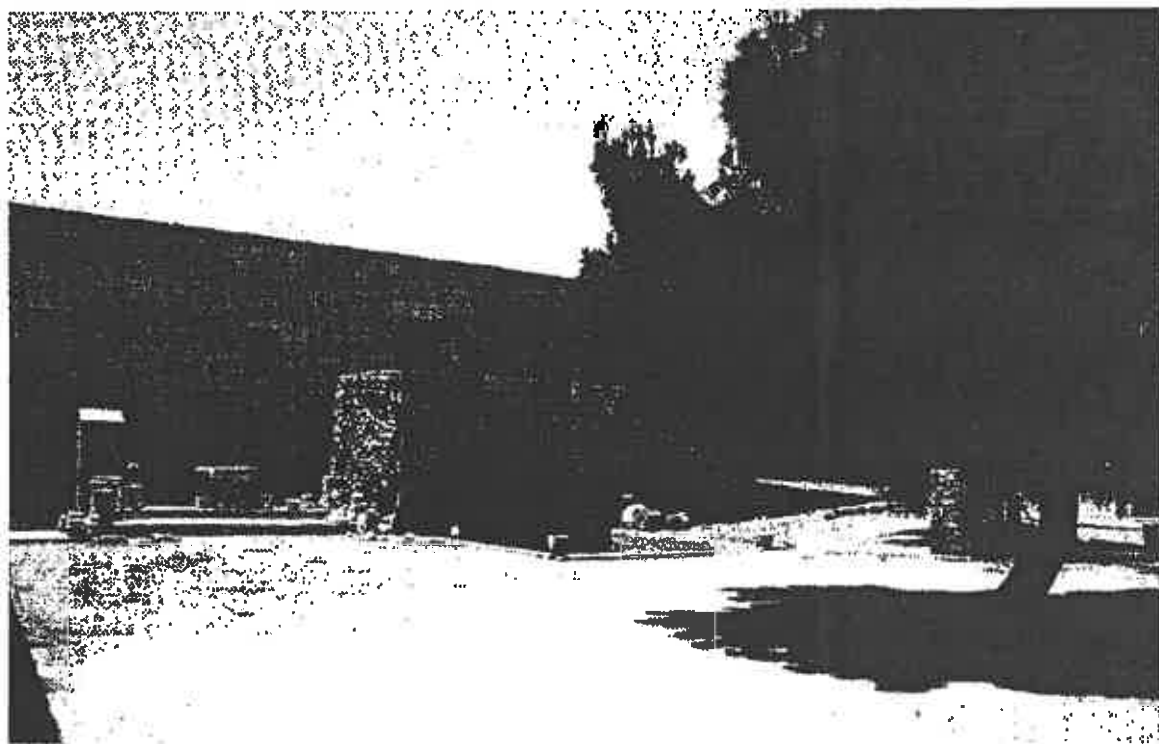
Fig. 3 : Le bâtiment principal dans la cour du manoir de Kouklia.

Le seul bâtiment dont des ruines imposantes ont été conservées – et presque complètement reconstruites –, le manoir de Kouklia, ne bénéficie d'aucun éclairage sur ses fonctions exactes dans les sources écrites (fig. 3 et 4) 63 . Inclus à un domaine royal qui fut un centre majeur de production sucrière 64 , il se présente sous l'aspect d'un bâtiment fortifié, haut d'un étage et organisé autour d'une vaste cour rectangulaire ; seule l'aile orientale comprend une grande salle basse voûtée en ogives et une salle haute de mêmes dimensions, à laquelle on accède par un perron depuis la cour. Sans avoir fait l'objet de fouilles au niveau de ses structures, le manoir a connu plusieurs états, ayant été dévasté en 1425 par les Mamelouks 65 ; aucune chronique, aucun récit de voyage ne décrit le monument, ni n'assure que les Lusignan fréquentaient le logis ; sans doute abritait-il le bailli, le personnel administratif, une partie des maîtres du sucre et des ouvriers faisant fonctionner la raffinerie située au-delà du manoir.