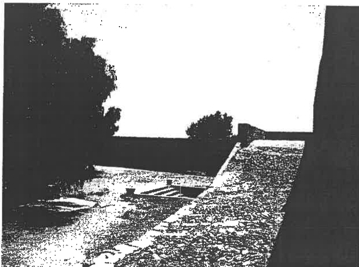
Fig. 4 : La cour du manoir de Kouklia depuis le perron de la salle haute.