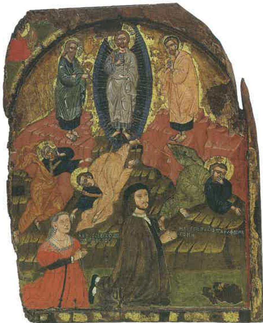
3. Agios Dimitrios (Marathassa), église Saint-Dimitrios, icône de la Transfiguration , 1530/1540 (Ιερά Μητρόπολις Μόρφου. 2000 Χρόνια Τέχνης και Αγιότητα, n° 35).