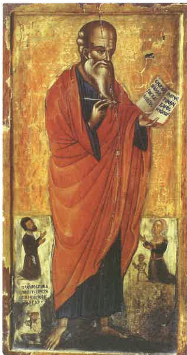
4. Paphos, Musée byzantin, icône de Saint Jean le théologien , 1562 (A. Papageorgiou, Εικόνες της Κύπρου , n° 100).