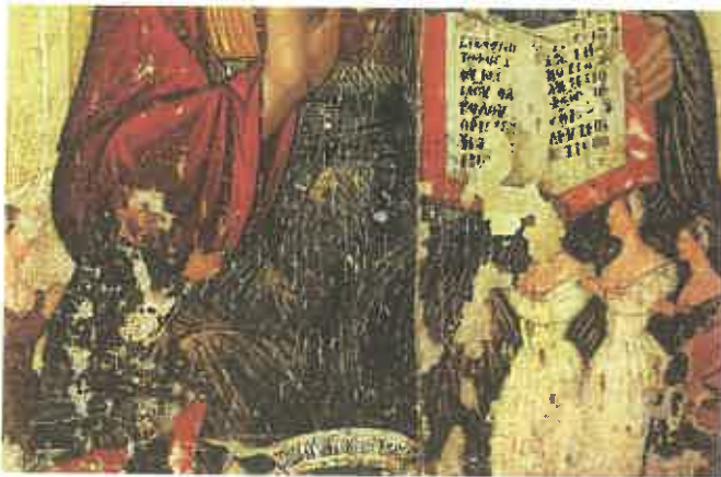
2. Nicosie, Musée byzantin de la Fondation culturelle de l'Archevêque Makarios III, icône du Christ bénissant , 1549 (A. Papageorgiou, Icones de Chypre , p. 93, détail).