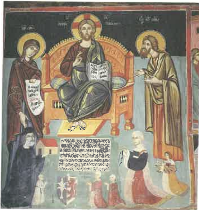
1. Galata, église de la Vierge Théotokos, panneau dédicatoire, 1514 (A. & J. A. Stylianou, The Painted Churches of Cyprus , n° 40).