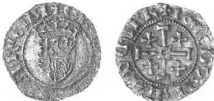
Fig. 1 : Gros de Charlotte de Lusignan, 1458–59 ; Nicosie, collection de la Fondation Culturelle de la Banque de Chypre.