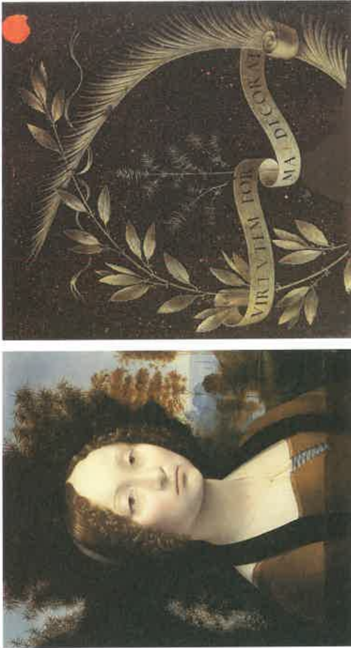
Leonardo da Vinci, Ginevra de' Benici , 1474-80, e rovescio; Washington, National Gallery of Art