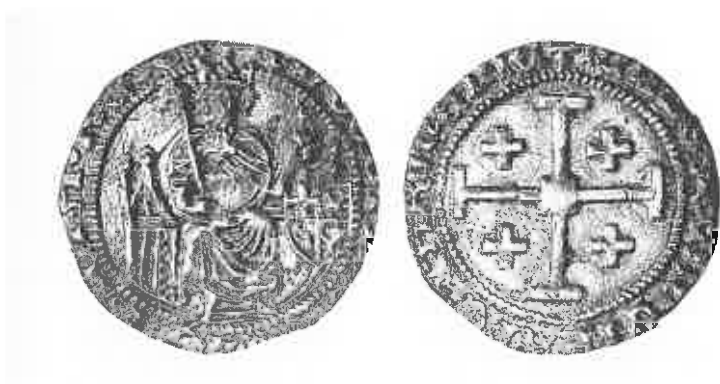
Fig. 2 : Gros de Louis de Savoie, 1459–61 ; Nicosie, collection de la Fondation Culturelle de la Banque de Chypre.

son trône, portant les regalia et flanqué de l'écu écartelé, celui figurant auparavant sur le gros de Charlotte, selon un modèle iconographique dont l'origine remonte à Pierre I er . 22 Ce retour à l'exercice masculin du pouvoir entend prévenir l'opposition suscitée par l'arrivée d'un prince étranger sur le trône, car l'installation de Louis de Savoie à Nicosie provoque la réaction du fils illégitime de Jean II, Jacques le bâtard, qui obtient l'appui d'une partie de l'aristocratie chypriote ; il reçoit en outre le soutien du sultan mamelouk, détenteur de la suzeraineté sur le royaume de Chypre depuis 1426, qui s'insurge à l'idée que l'île puisse être gouvernée par une femme. 23 Dès le mois d'octobre 1460, Char-