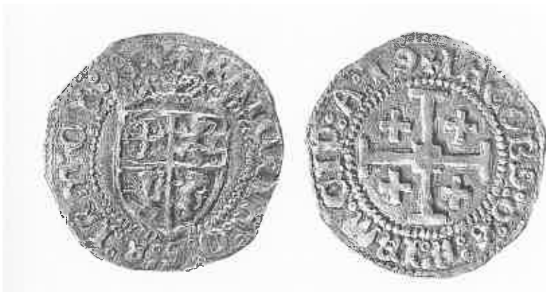
Fig. 4 : Gros de Catherine Cornaro et de Jacques III de Lusignan, 1473–74 ; Nicosie, collection de la Fondation Culturelle de la Banque de Chypre.

Les seules images publiques de Catherine Cornaro comme reine de Chypre proviennent de la numismatique et elles montrent une nette évolution de l'iconographie. Lorsque Catherine accède au trône, après la mort de Jacques II, dans la nuit du 6 au 7 juillet 1473, elle exerce la régence pour le fils dont elle est enceinte, le futur Jacques III, qui disparaîtra un an plus tard, le 26 août 1474. Les gros frappés pendant cette période le sont, sur l'avvers, au nom de Katerina , sur le revers, au nom de Iacobus , chacun portant le titre souverain pour Jérusalem, Chypre et l'Arménie (fig. 4) 28 ; on remarque, cependant, que l'écu écartelé des Lusignan remplace la figure des souverains, comme on a pu l'observer sur le gros de la reine Charlotte. Là encore, la gravure des armes de la famille régnante légitime le principe de la transmission du pouvoir.