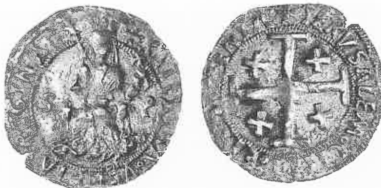
Fig. 5 : Gros de Catherine Cornaro, 1474–89 ; Nicosie, collection de la Fondation Culturelle de la Banque de Chypre.

titulature « Ierusalem Cipri et Armeniae ». De toute l'histoire numismatique du royaume franc, ce gros est l'unique exemple montrant une femme en situation de souveraine, signe de l'affirmation de Catherine Cornaro comme détentrice du pouvoir politique. On aura cependant relevé l'ambiguïté : Katerina Veneta et non Katerina Corner , ce qui illustre l'association de la personne et de sa famille au pouvoir de Venise. À elle seule, cette pièce restitue le processus de transition par lequel le royaume franc bascule dans l'orbite vénitienne.