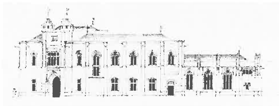
Fig. 6 : Reconstitution de la façade extérieure du dernier palais des Lusignan à Nicosie par George Jeffery.

8000 ducats, soit 2000 ducats de moins que le montant réclamé par Catherine dans sa lettre du 14 avril 1475. 76