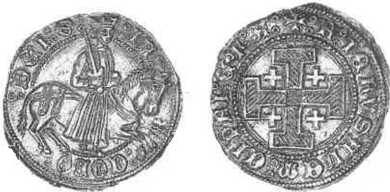
Fig. 3 : Gros de Jacques II de Lusignan, 1460–73 ; Nicosie, collection de la Fondation Culturelle de la Banque de Chypre.

La victoire de Jacques le bâtard signifie le retour d'une forme de vie politique dominée par la ruse et la violence, mises au service d'un authentique sens de la restauration de l'autorité royale, tant à l'intérieur du pays que sur l'échiquier diplomatique. Cette politique virile se matérialise par le prototype du chef militaire à cheval brandissant son épée, qui apparaît sur le gros frappé après 1463 (fig. 3) ; 24 elle se poursuit à travers le souci d'assurer des héritiers au trône, car Jacques sème trois bâtards avant d'épouser Catherine Cornaro. 25 Sans entrer dans les circonvolutions suivies par Jacques II dans les affaires méditerranéennes de son époque, on peut créditer ce jeune roi, âgé de seulement 21 ou 22 ans en 1460, d'une remarquable détermination dans l'administration du royaume. Il incarne un pouvoir fort et capable d'initiatives pour stimuler la prospérité économique de l'île ; aucun des chroniqueurs du royaume ne doute de son habileté et de sa ténacité. 26