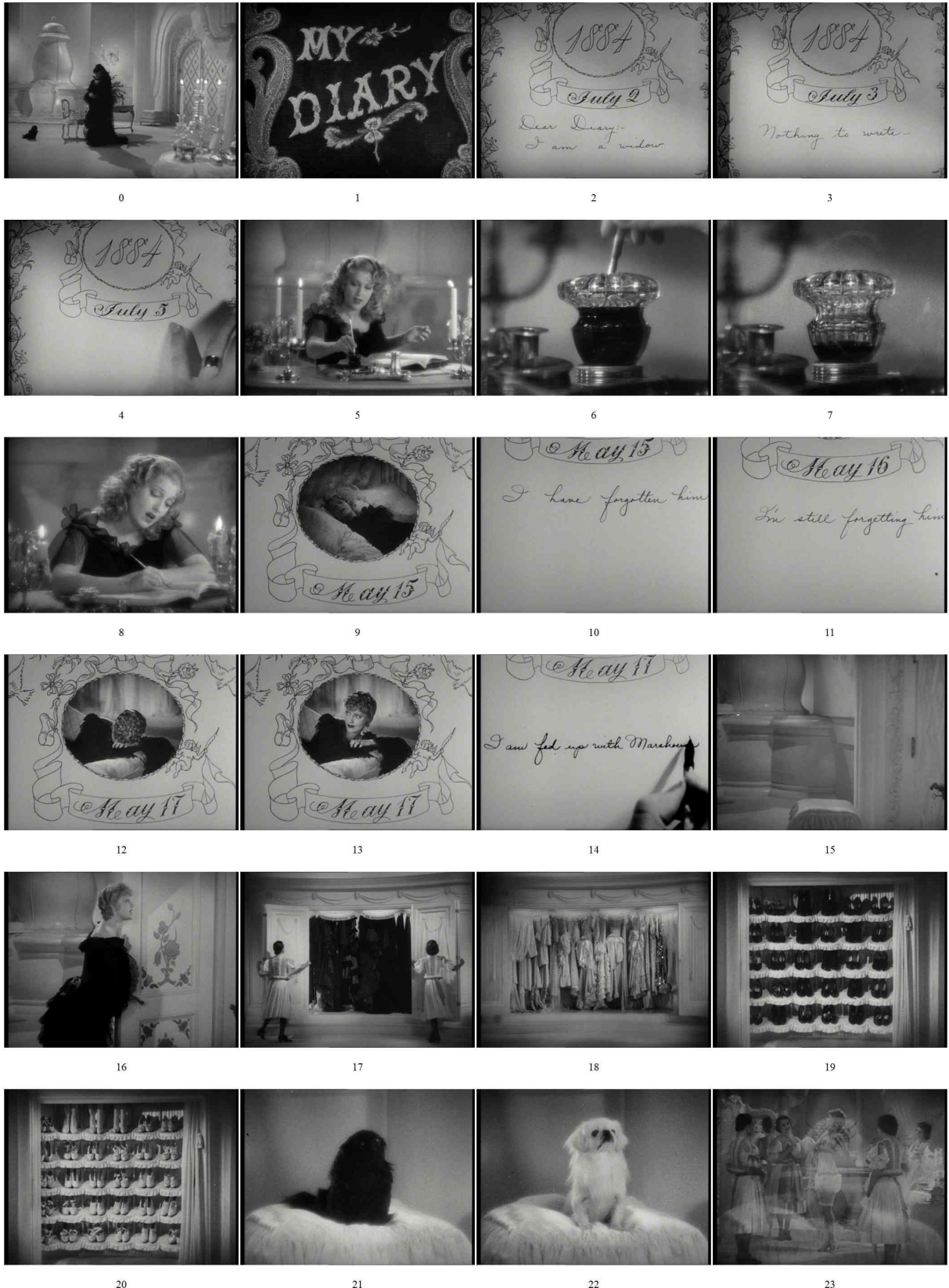
Fig. 3 : photogrammes extraits de la version anglophone de La Veuve joyeuse .