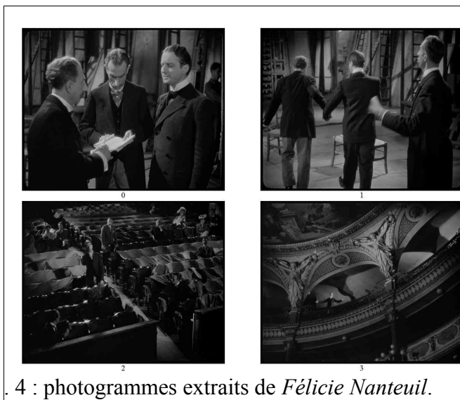
Fig. Ce renvoi de l'auteur dans les coulisses avait déjà été amorcé par une réplique du metteur en scène répondant à l'auteur révolté (phot. 0) :

du metteur en scène. La défaite de l'acteur du passé est associée explicitement, non seulement à celle du discours théâtral mais à celle de l'auteur, littéralement renvoyé à l'arrière-plan dans cette séquence 50 , grâce à trois procédés ponctués par la reprise de la même réplique : « je retire ma pièce ! ». L'auteur l'énonce une première fois en sortant du champ (fig. 4 : phot. 1), puis une deuxième fois alors qu'il demeure invisible, depuis le hors-champ. Enfin, il la répète à deux reprises dans deux plans de coupe (phot. 2 et 3) qui le filment de plus en plus loin, le faisant paraître de plus en plus minuscule. Le découpage impose ainsi son propre discours critique alors même que le dialogue théâtral est réduit au silence, que l'acteur de théâtre, devenu acteur burlesque, ne peut plus s'exprimer que par la performance physique et le bruit.