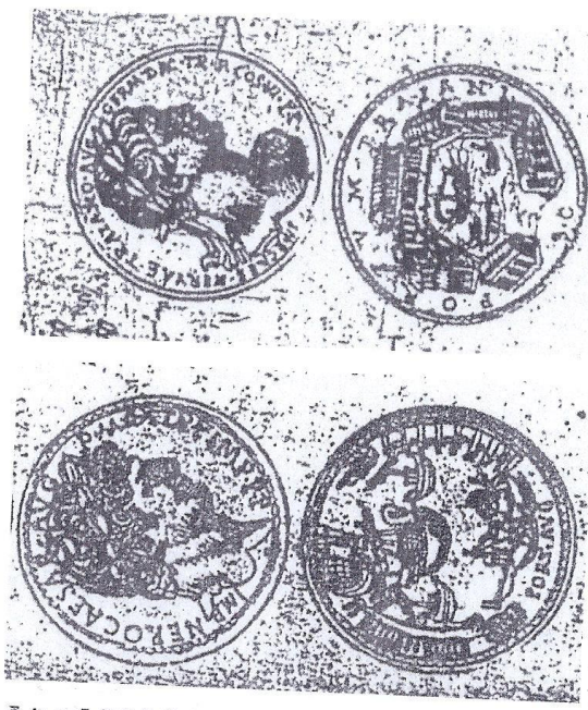
Tav. XXVII. Torino, Archivio di Stato, cod. Ja II 1 (vol. 14), f. 104r: le phare d'Alexandrie. 2. Cod. Ja II 8 (vol. 21), f. 218r: « Di Nerone Cesare Augusto ». 3. Cod. Ja II 8 (vol. 21), f. 212r: revers de la médaille de Trajan avec le port d'Ostie.

negata una delle suoi supradette de purnepi et pulmo pua de se, se sopra fene il gran pua de