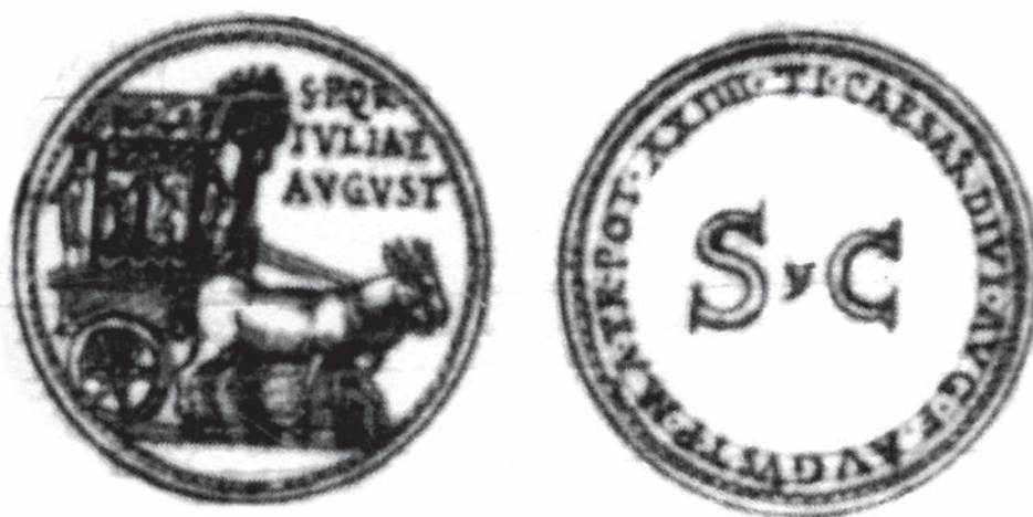
Fig. 6. Torino, archivio di stato, Ja.II.8, f.125r.

Pour sa part, Ligorio appellera thensa le véhicule figurant sur la monnaie de Julie, qu'il reproduit dans le chapitre consacré aux monnaies de Tibère (fig. 6), tout en reconnaissant, dans le chapitre de son traité consacré à ce véhicule, qu'il était parfois confondu avec le carpentum 19 : Non è da dubitar punto in questi rovesci di questa medaglia fatta nel vintesimo quarto anno dell'imperio di Tiberio, che questi carri che vi sono non siano il carro chiamato TEMPSA, il quale s'usava menar nelli ludi circensi dopo la morte dell'imperadori, quando erano chiamati divi, il cui honore consegui Iulia figliola di Augusto chef u moglie di Tiberio et consenso del senato e popolo romano.