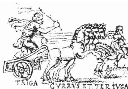
Fig. 13. Stresa, archivio Borromeo