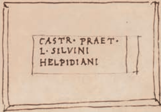
Tab. III – Biblioteca Apostolica Vaticana, Vat. lat. 3439, f. 169r n. 9.