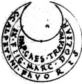
Tab. IV – LIGORIO, XIII.B.7, p. 179 (Naples, Biblioteca Nazionale).

Onogoris ] Oniguri . Menandro Prote- ctori in excerpt. Legat. qui cum Zalis conjungit .